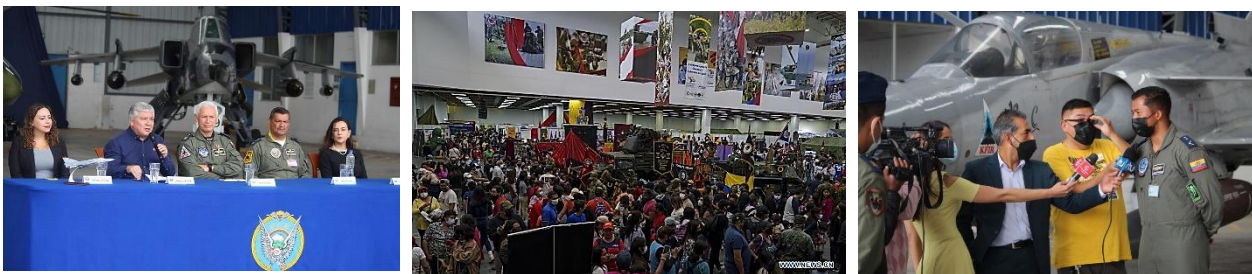
Gráfico 1 Estrategias comunicaciones vanguardistas

El Sistema de Comunicación Social FAE se logró compartir información para su oportuna difusión en los canales de comunicación institucionales, en los que se generó interacción entre la Fuerza Aérea Ecuatoriana, su personal y la ciudadanía en general.