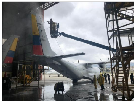
Gráfico 8 Trabajos C295M