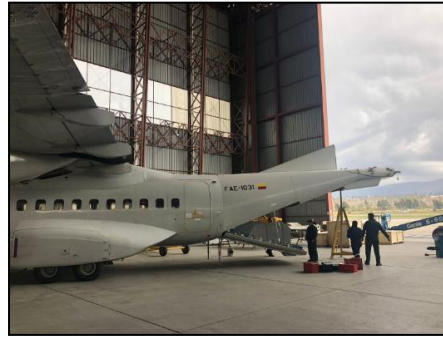
Gráfico 6 Mantenimiento